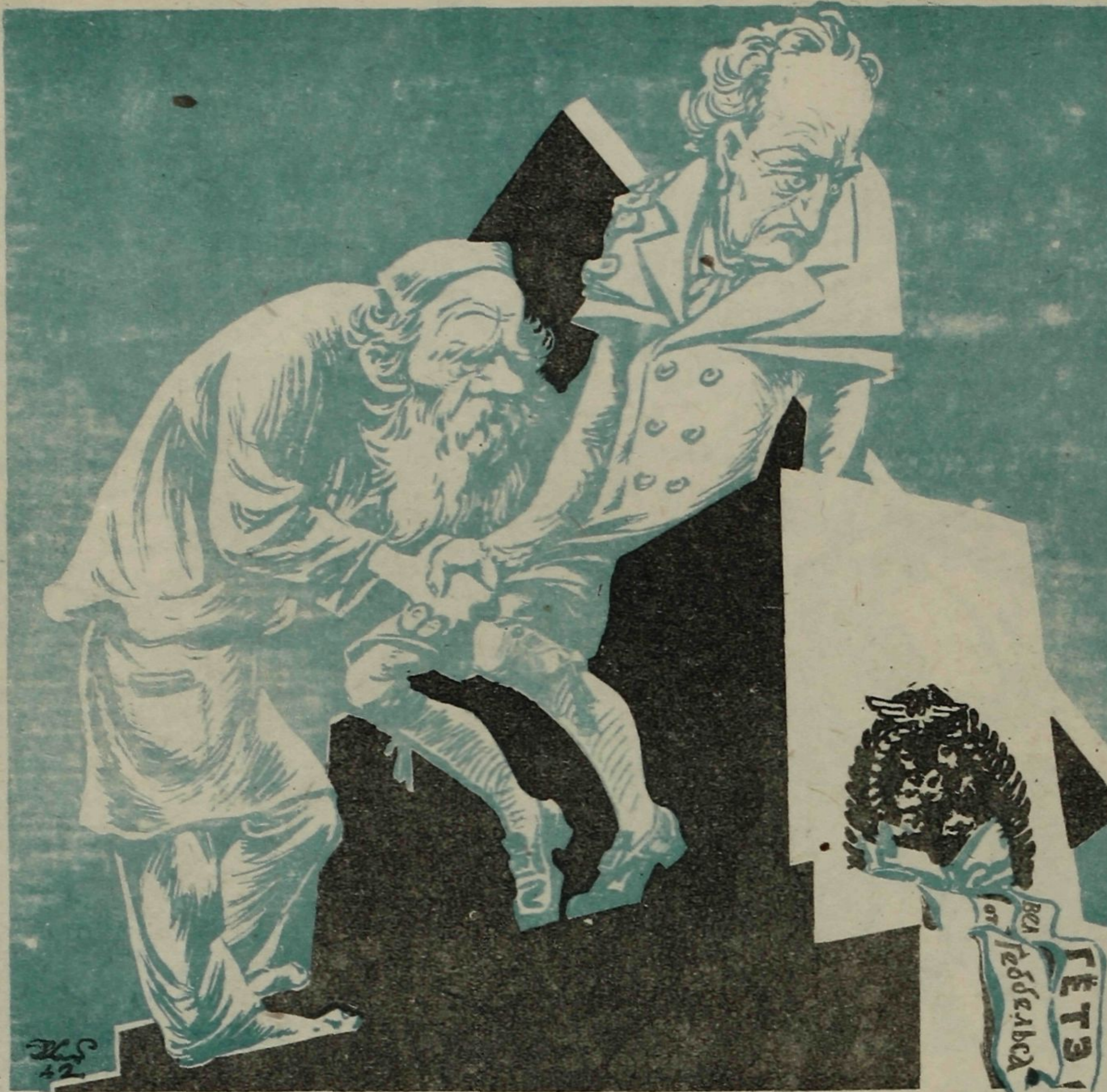
ЛЕВ ТОЛСТОЙ: — Выражаю вам свое глубокое соболезнование. Мою могилу они тоже осквернили.

Роняя листья, лес дубовый Осенней полон желтизны. Приметы осени суровой Яснее с каждым днем видны.