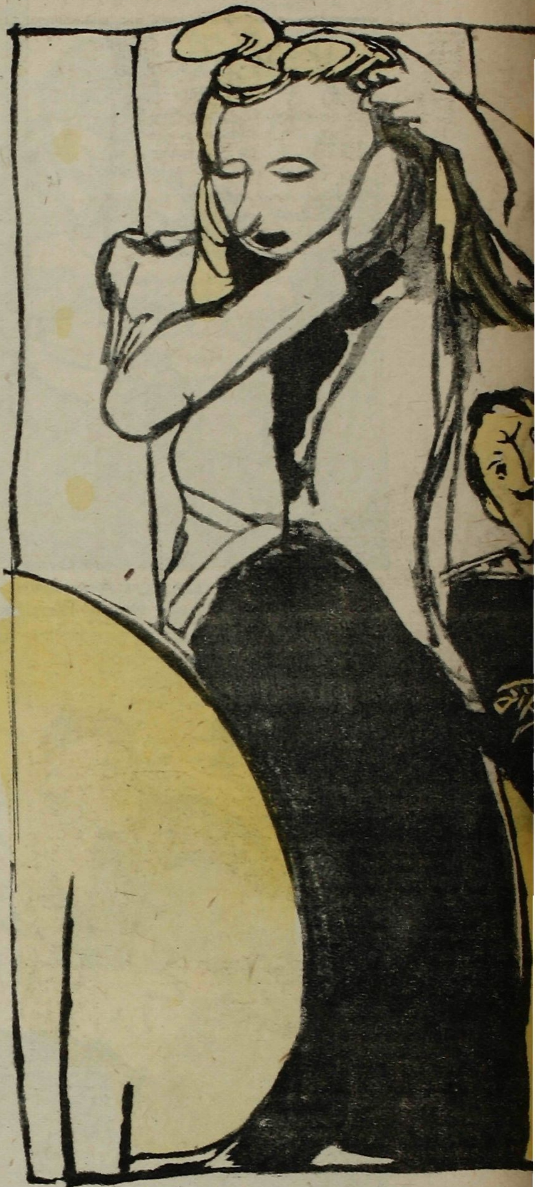
— Теперь ты видишь, Гретхен, союзник.