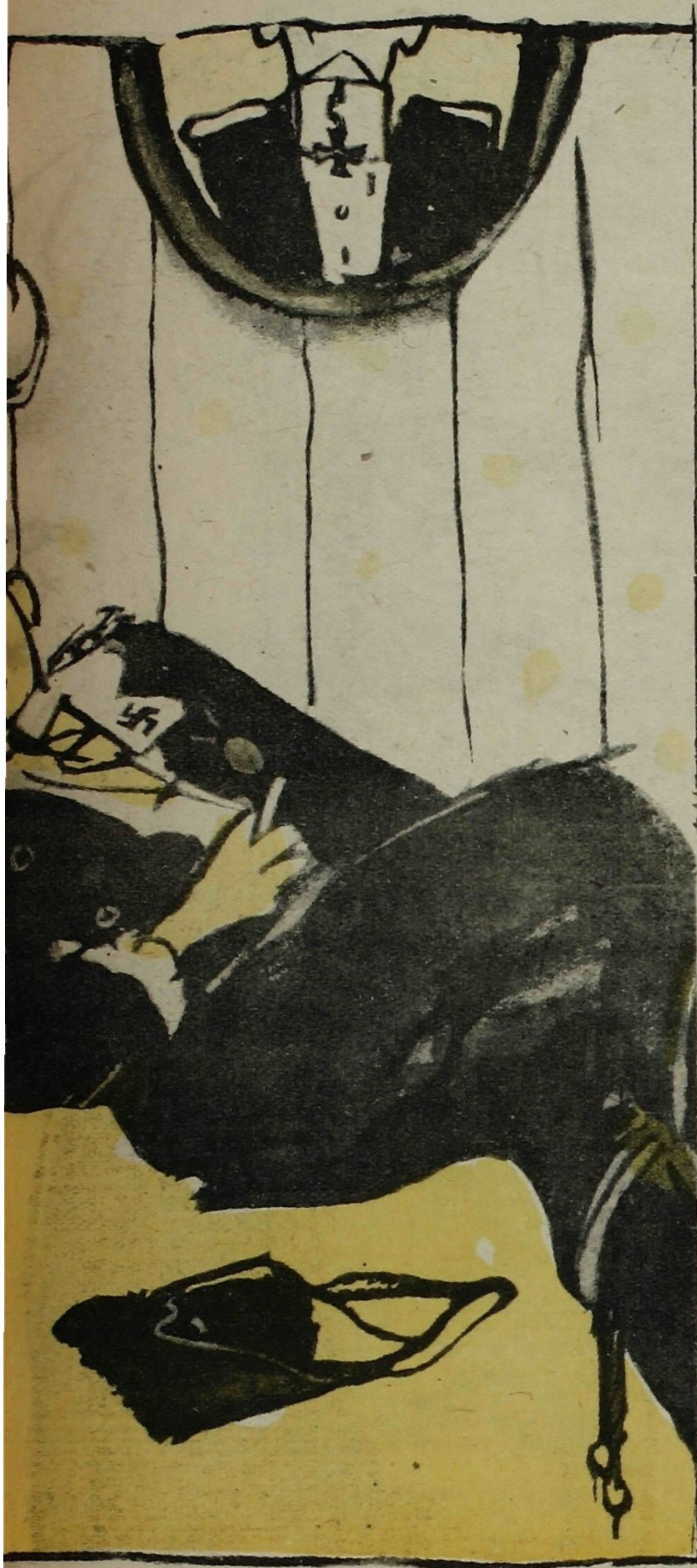
то я твоему мужу настоящий